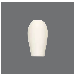
Tischvase , Flower vase, Vase à fleurs, Florero, Vaso per fiori