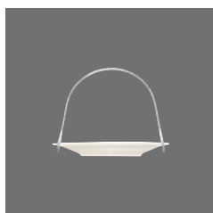
Petits-Fours-Schale, Bowl „Petits Fours“, Ravier „Petits Fours“, Bowl „Petits Fours“, Piatto „Petits Fours“