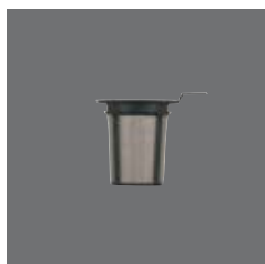
Teesieb Kunststoff , Teastrainer plastic, Filtre plastique à thé avec anse mobil, Colador de sintético de te, Filtro in plastica