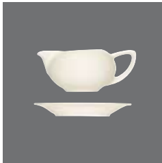
Sauciere , Sauce-boat, Saucière, Salsera, Salsiera