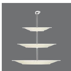
Etagere , Etagère, Etagère, Etagère, Etagere