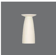
Leuchter , Candleholder, Bougeoir, Candelabro, Candeliera