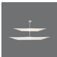
Etagere , Etagère, Etagère, Etagère, Etagere