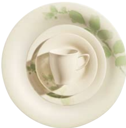
418480 Fleury Grün Hohlteile undekoriert, Hollowware undecorated, Articles creux sans décor, Piezas complementarias sin decorar, Articoli cavi senza decoro