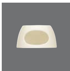
Stövchen , Plate warmer, Réchaud, Calentador, Scaldateiera