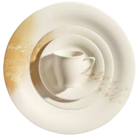
418440 Poème Hohlteile undekoriert, Hollowware undecorated, Articles creux sans décor, Piezas complementarias sin decorar, Articoli cavi senza decoro