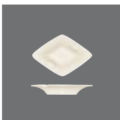
Ascher , Ashtray, Cendrier, Cenicero, Posacenere