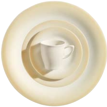
418460 Bellevue Hohlteile undekoriert, Hollowware undecorated, Articles creux sans décor, Piezas complementarias sin decorar, Articoli cavi senza decoro