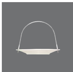
Petits-Fours-Schale, Bowl „Petits Fours“, Ravier „Petits Fours“, Bowl „Petits Fours“, Piatto „Petits Fours“