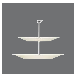
Etagere , Etagère, Etagère, Etagère, Etagere