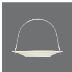
Petits-Fours-Schale, Bowl „Petits Fours“, Ravier „Petits Fours“, Bowl „Petits Fours“, Piatto „Petits Fours“