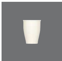
Teesieablage , Bowl for teastrainer, Support pour filtre, Bowl para colador de sintético de te, Tazza per filtro