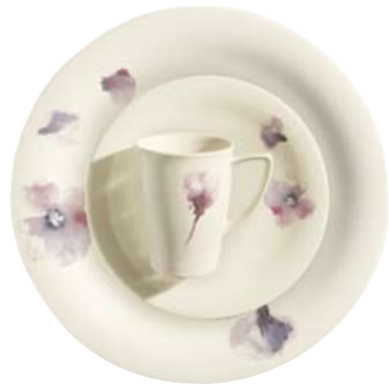
418450 Fleury Violet