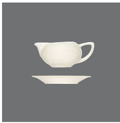
Saucenschälchen , Sauce-boat small, Saucière petite, Salsera pequeña, Salsiera