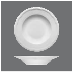
Teller tief Fahne, Plate deep with rim, Assiette creuse à l'aile, Plato hondo con ala, Piatto fondo