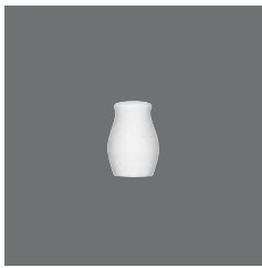
Salzstreuer glatt , Salt shaker plain, Salière simple, Salero liso, Spargi sale liscio