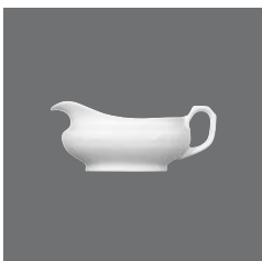
Sauciere, Sauce-boat, Saucière, Salsera, Salsiera