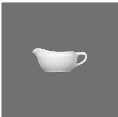
Saucenschälchen, Sauce-boat small, Saucière petite, Salsera pequeña, Salsiera