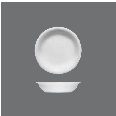
Kompottschale rund, Fruit saucer round, Compotier rond, Compotera redonda, Coppetta rotonda