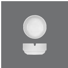
Ascher , Ashtray, Cendrier, Cenicero, Posacenere