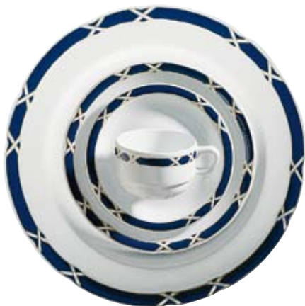
413810 Charlottenburg Blau-Gold - Farbiges Band