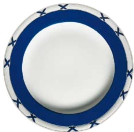
413820 Charlottenburg Blau-Gold - Farbige Kreuze mit Fond Nur auf Tellern und Platten, Only on plates, platters, Uniquement sur les assiettes, les plats, Solo en platos y bandejas, Solo su piatti e piastre