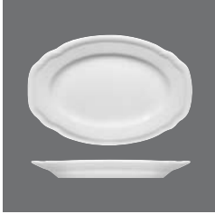
Platte oval Fahne, Platter oval with rim, Plat ovale à l'aile, Fuente oval con ala, Piatto ovale