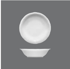
Salatiere rund, Salad dish round, Saladier rond, Ensaladera redonda, Insalatiera rotonda