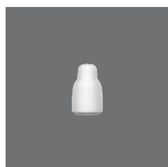
Salzstreuer, Salt shaker, Salière, Salero, Spargi sale

> Sauciere 25 3830 2575/0.30 0,30 (10.14) 152 (5.98) 66 / 317(5) 270