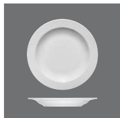
Teller halbtief Fahne, Plate half-deep with rim, Assiette demi-creuse à l'aile, Plato medio hondo con ala, Piatto semifondo