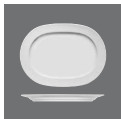
Platte oval Fahne, Platter oval with rim, Plat ovale à l'aile, Fuente oval con ala, Piatto ovale