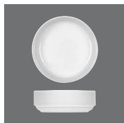
Salatiere rund, Salad dish round, Saladier rond, Ensaladera redonda, Insalatiera rotonda