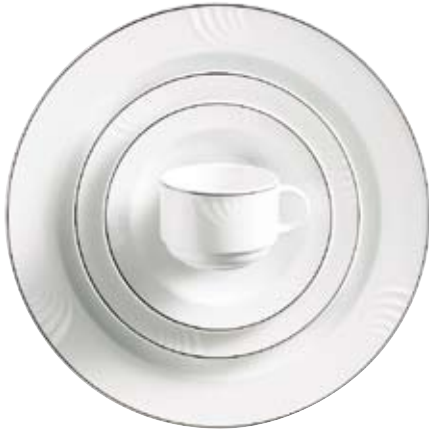
800144 Farblinie Schwarz