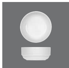
Suppenschale, Bowl, Bol, Bowl, Coppetta

> Bowl rund 0.27 25 6510 2558/0.27 0,27 (9.13) 95 (3.74) 56 / 456 195