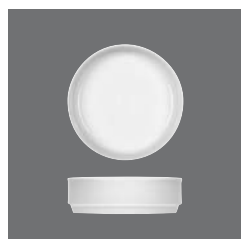
Eintopfschale, Stew bowl, Bol à plat unique, Ensaladera redonda, Insalatiera rotonda