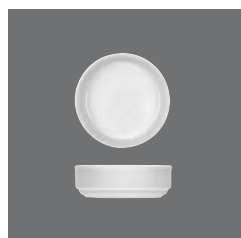
Kompottschale rund, Fruit saucer round, Compotier rond, Compotera redonda, Coppetta rotonda