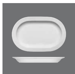
Platte oval halbtief Fahne, Platter oval half-deep with rim, Plat ovale demi-creux à l'aile, Fuente oval con ala, Piatto ovale semifondo