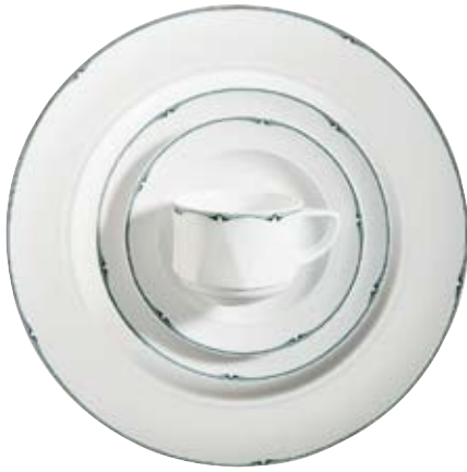
409230 Piccola Lagerdekor, Stock decoration, Décoration de stock, Decorado de stock, Decoro su articoli in magazzino