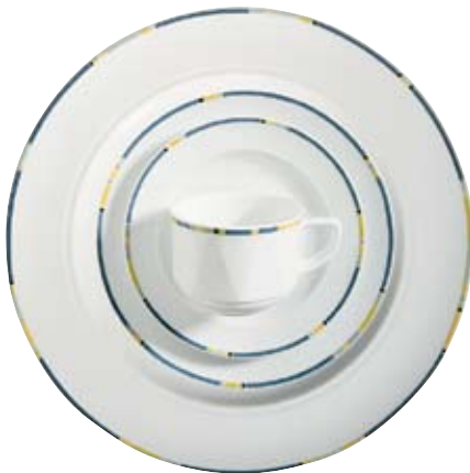
409500 Combo Blau