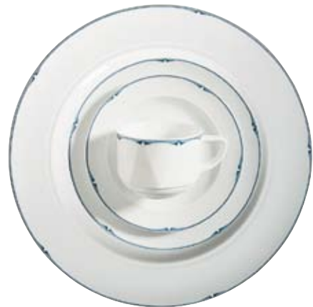
409520 Piccolo Blau