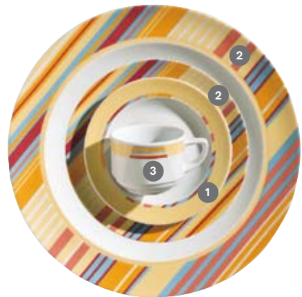
① 418280 Toccata Fond ② 418290 Toccata Streifen ③ 418300 Toccata