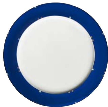
413380 Castino Blau

Nur auf Tellern und Unteren, Only on plates and saucers, Uniquement sur les assiettes et les soucoupes, Solo en platos y platitos, Solo su piatti e piattini