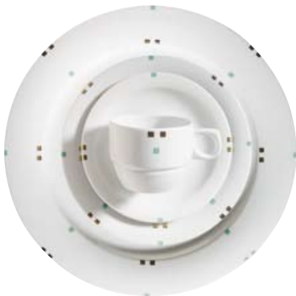
413390 Castino Weiß